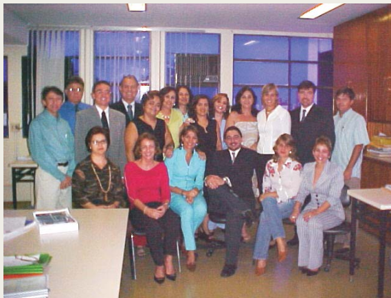
Equipe de Auditoria de Programa de Governo

Os programas auditados foram o Renda Cidadã, Asfalto Novo, Salário Escola, Lavouras Comunitárias e Gestão, Conservação e Proteção Ambiental.