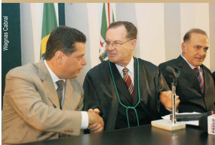
O governador Marconi Perillo prestigiou a posse dos novos dirigentes do Tribunal de Contas