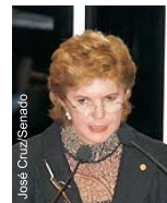
Deputada Lúcia Vânia