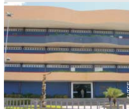
Fachada do TCE-PI, em Teresina

ooo O Tribunal de Contas do Piauí está realizando concurso público para os cargos de Auditor, Auditor Fiscal de Controle Externo (áreas de Ciências da Computação e Engenharia) e de Procurador.